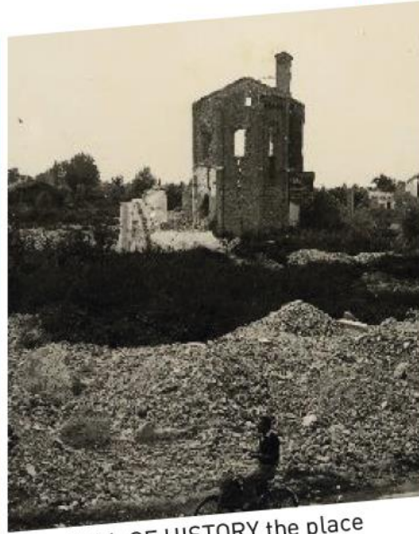
THE WALL OF HISTORY the place where there was the old church, destroyed during the May '44 bombing