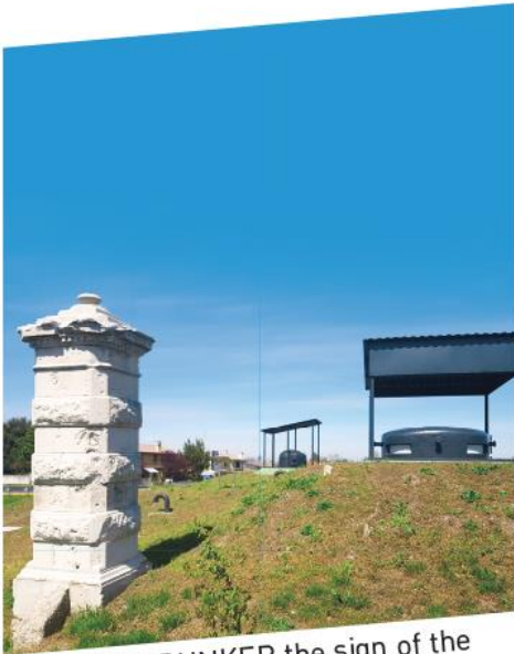
COLD WAR BUNKER the sign of the political, ideological and military contrast