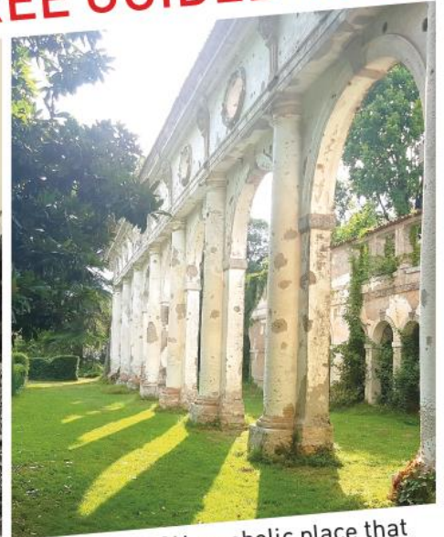
VILLA IVANCICH symbolic place that has hosted the writer and Nobel Prize Ernest Hemingway